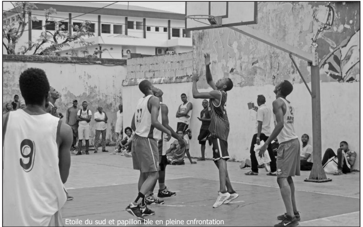
Etoile du sud et papillon ble en pleine confrontation