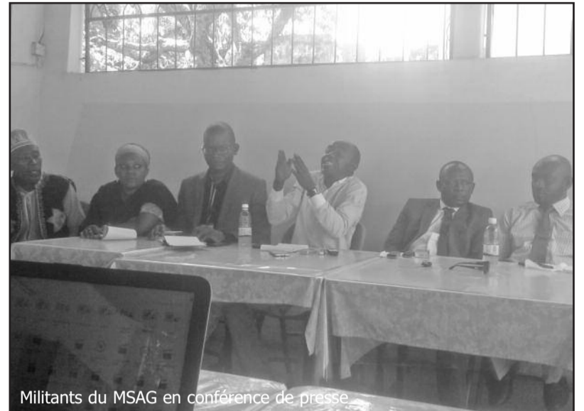
Militants du MSAG en conférence de presse.