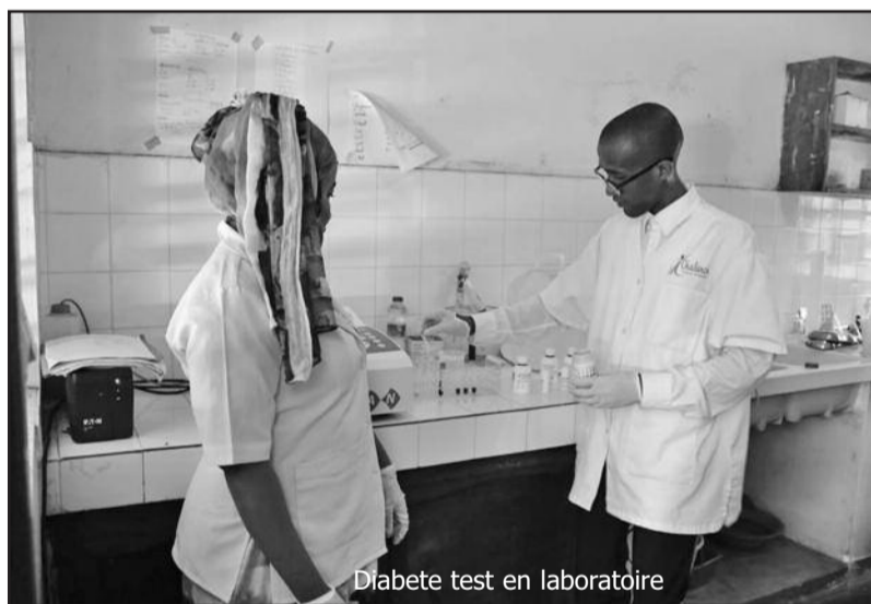
Diabete test en laboratoire

d'identifier les progrès réalisés et les défis rencontrés dans la mise en